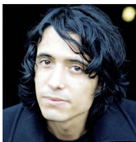
JONAS HASSEN KHEMIRI