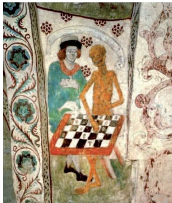
Albertus Pictors målning "Döden spelar schack med människan" i Täby kyrka, inspirerade Ingmar Bergman till den berömda scenen i Det sjunde inseglet

Den 25 maj erbjuds möjlighet att göra studiebesök på ett av Täbys framgångsrika företag, antingen SÖRAB:s största återvinningsanläggning Hagby eller kvalitetscertifierade Byängsskolan. Därefter tittar vi närmare på Runriket och Albertus Pictors målningar. Läs mer i mittspalten.