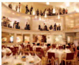
Best Western Täby Park hotell